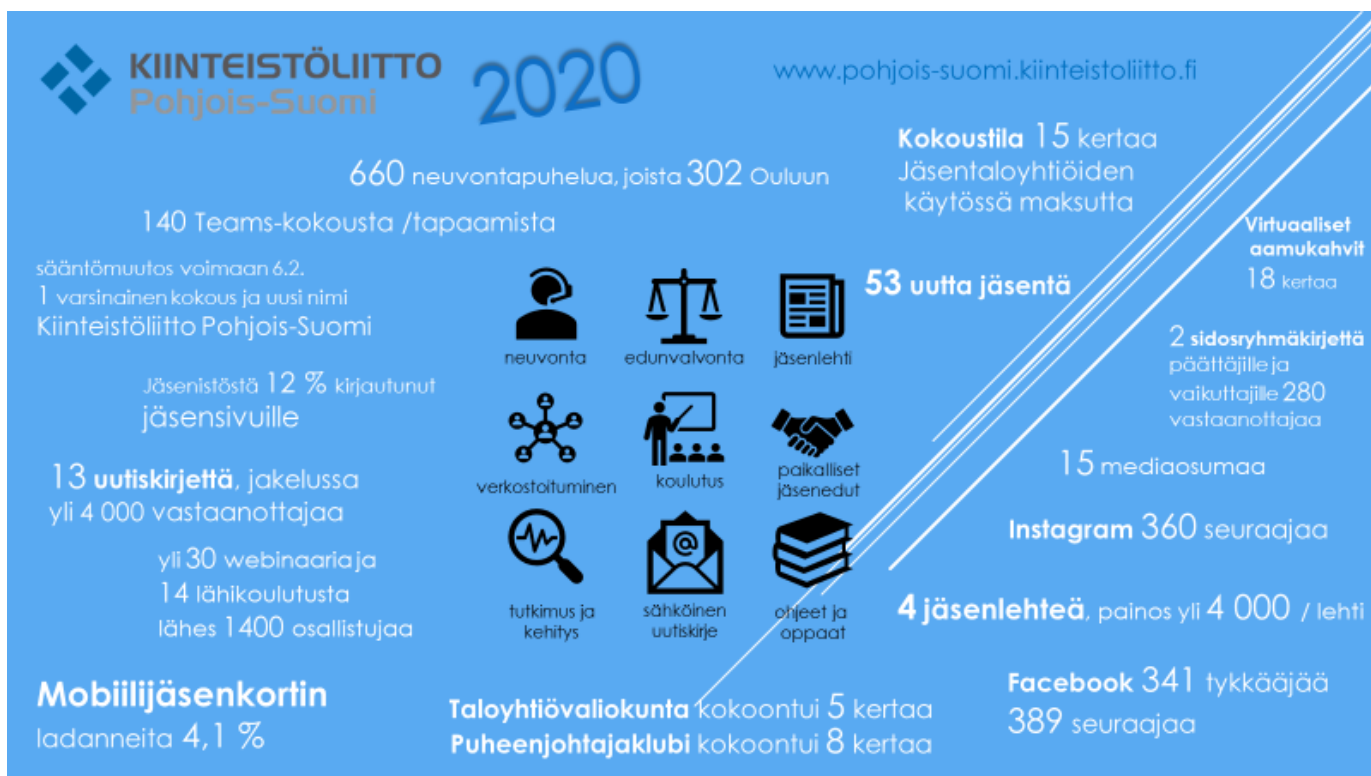
Kuva 1. Kiinteistöliitto Pohjois-Suomen vuosi 2020 luvuin

Yhdistykselle tehtiin viime vuonna toimintahistorian ensimmäinen viestintäsuunnitelma. Yhdistys valmistautui kevään 2021 kuntavaaleihin kirjaamalla joulukuun hallituksessa kuntavaalitavoitteet kaudelle 2021 – 2024. Teemoiksi nousivat asumiskustannukset – asumisen kustannuskehitys on taitettava, kuinka kunta tukee ja mahdollistaa lisä- ja täydennysrakentamisen sekä ikääntyvien asumisen ennakointi kunnissa.